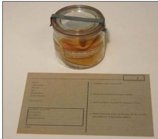
Doc 2 - Pot à odeur utilisé par la Stasi pour ficher les personnes suspectes. La police politique, appelée Stasi , compte 90 000 agents qui surveillent la population à l'aide de caméras et de 200 000 « informateurs ».