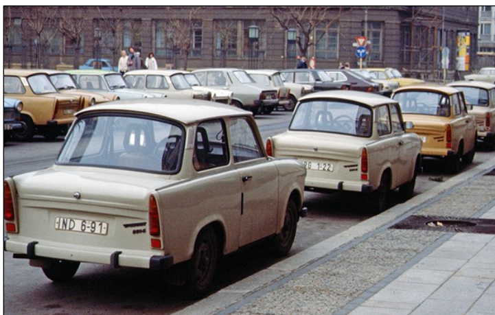
Doc 5 - L'État communiste contrôle la production, on fournit à chaque habitant les marchandises dont il a besoin, avec plus ou moins de retard. Il fallait en moyenne 12 ans pour obtenir une Trabant. Affectueusement surnommée « Trabi », cette voiture populaire possède une carrosserie en Duroplast, un composite de plastique qui permet de palier le manque d'acier en RDA.