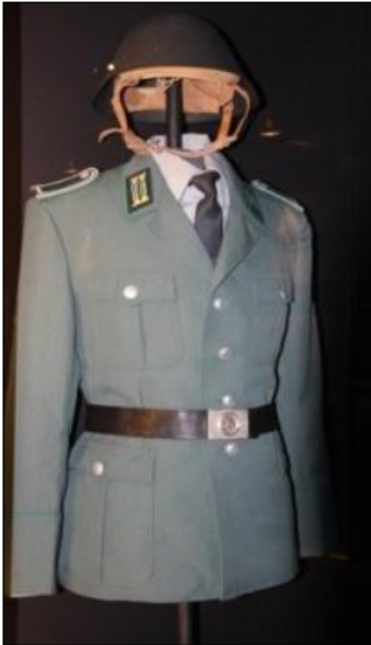
Doc 1 - Uniforme de Vopo (Volkspolizei), la police de l'Allemagne de l'Est.