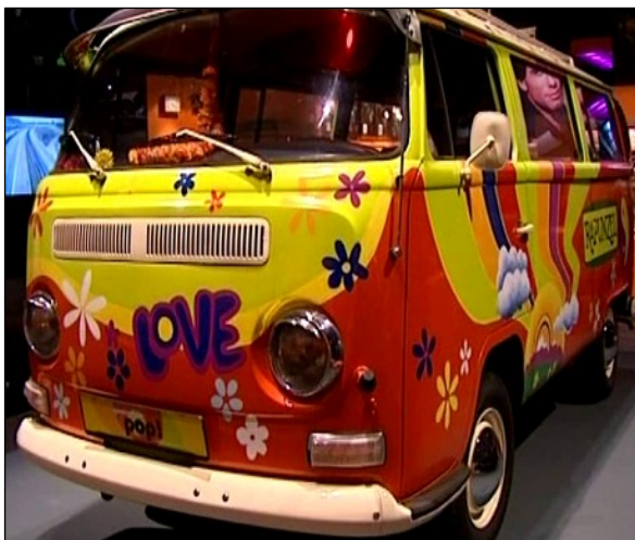
Doc 3 - Le combi Volkswagen

Après la fameuse Coccinelle, ce modèle Volkswagen symbolise la liberté de déplacement mais aussi la libéralisation des mœurs.