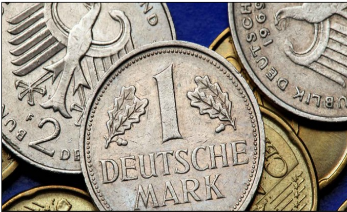
Doc 1 - La réforme monétaire de 1948 remplace le Reichsmark par le Deutsche Mark et soutient la réussite économique de la RFA.