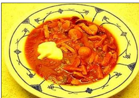
Doc 7 - En RDA, le chômage n'existe pas. L'accès à l'éducation et au système de santé est totalement gratuit. Cependant, le niveau de vie reste inférieur à celui de l'Ouest. Le ravitaillement est difficile, on fait la queue devant les boutiques mal approvisionnées. Les Ossis mangent régulièrement la Soljanka, sorte de ragoût cuisiné avec ce que l'on trouve dans les magasins d'alimentation.