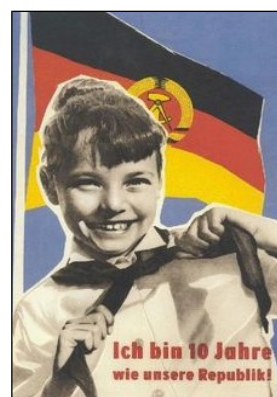
Doc 6 - Les Pionniers doivent prêter serment de fidélité à la RDA, à l'amitié avec l'URSS et au communisme.