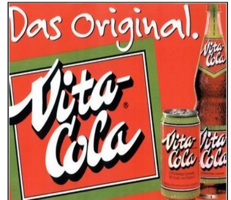
Doc 3 - Le Coca-cola de l'ennemi américain est interdit. En 1957 est lancé le Vita-Cola, une limonade avec des fruits et un mélange d'herbes.