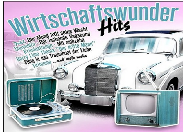
Doc 2 - Grâce au plan Marshall , la RFA connaît un véritable « Wirtschaftswunder » (« miracle économique ») : plein-emploi, croissance et prospérité économique. La RFA devient très vite la 3 ème puissance économique mondiale, derrière les Etats-Unis et le Japon.