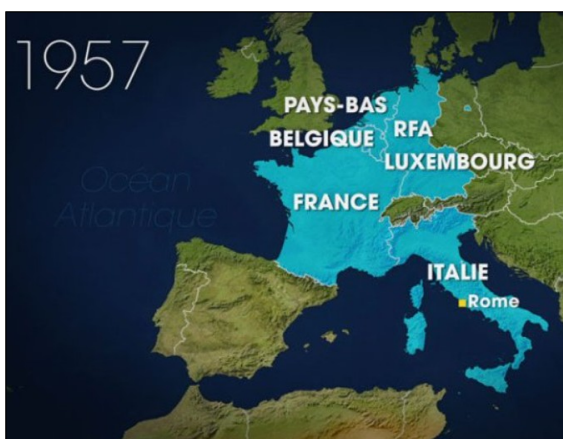
Doc 5 - La RFA fait partie des 6 États qui signent le Traité de Rome en 1957 : c'est la naissance de l'Union européenne. Le but est de faire de l'Europe de l'Ouest un espace de paix, de liberté et de prospérité.