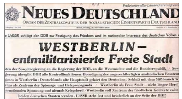
Doc 4 - Une du Neues Deutschland La presse est étroitement contrôlée par l'Etat. Les articles ne doivent contenir aucune critique à l'égard du parti communiste.