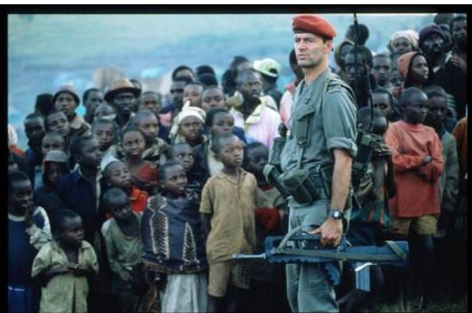
Soldat français dans le camp de réfugiés tutsi de Nyarushishi (Gisenyi, Rwanda), 24 juin 1994

Benoît Collombat et Cellule investigation de Radio France