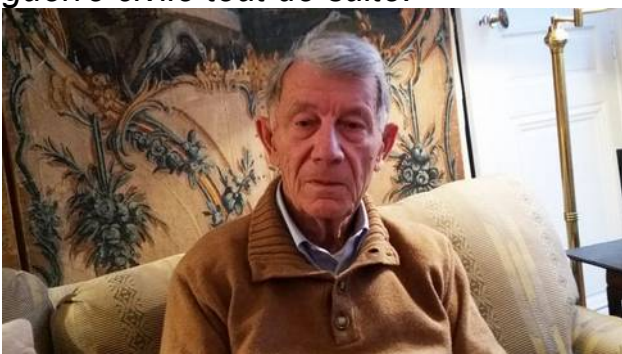
L'amiral Jacques Lanxade

"Nous n'allions pas nous retirer, poursuit l'amiral Lanxade. On était là justement pour empêcher ce que Varret pensait comme une éventualité possible [le génocide] par une coopération technique avec la gendarmerie, avec les FAR (Forces armées rwandaises). Notre intervention visait à éviter que le gouvernement ne s'effondre et ne tombe dans la guerre civile. Qu'aurions-nous dû faire ? Partir ? Mais alors c'était la guerre civile tout de suite."