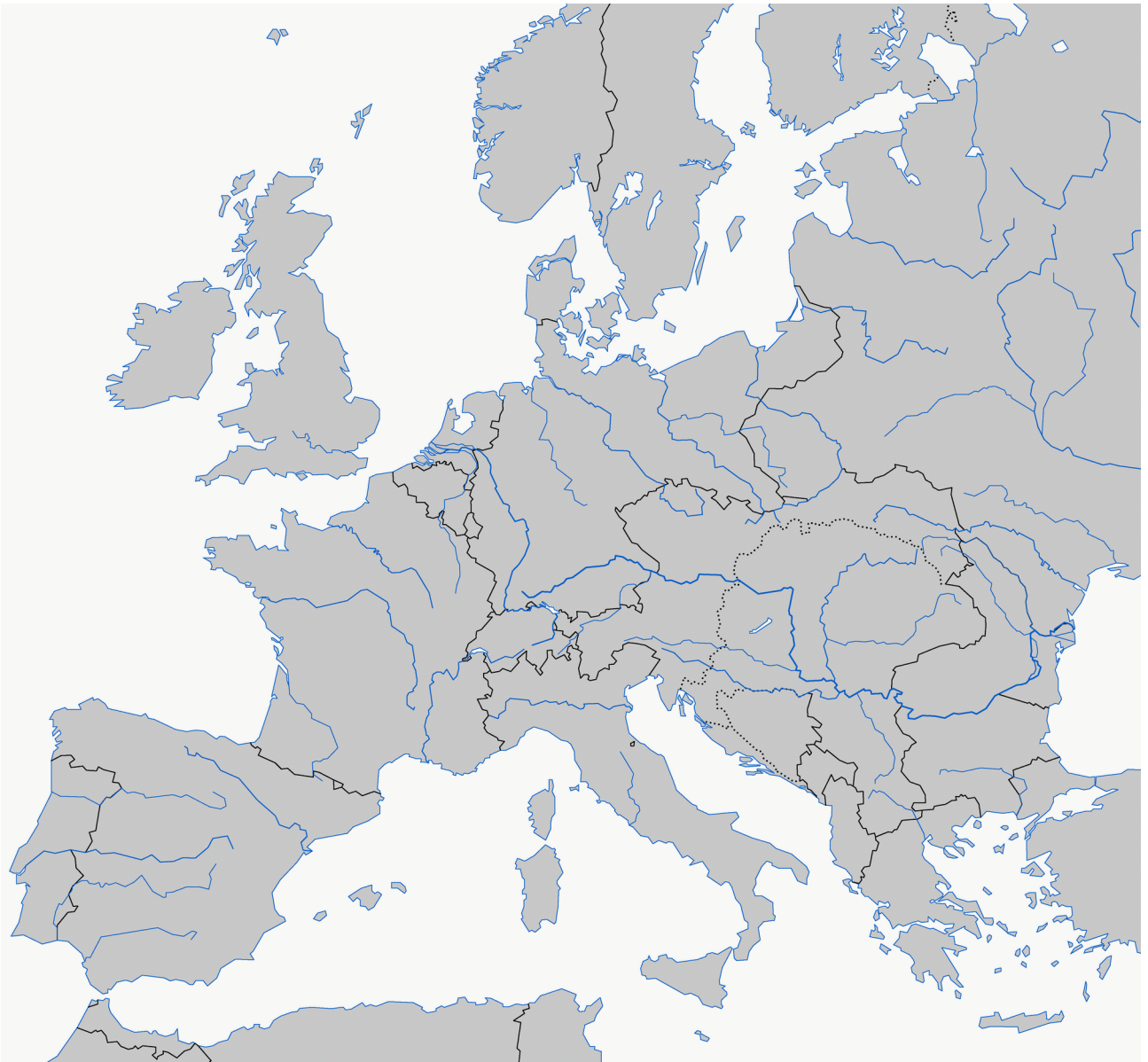
L'Europe en 1914