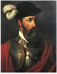
Francisco Pizarro 1532